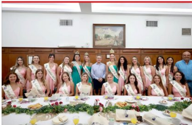
Uno de los clásicos eventos previos a cada Fiesta de la Vendimia es el desayuno del intendente con las candidatas al cetro departamental. (Pág.5)

"Si bien todos estamos haciendo un esfuerzo para sostener la gobernabilidad, el sector de la tercera edad es la más sacrificada" dijo Markarian. (Pág. 3)