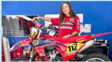
Radicada en la provincia de Córdoba, la deportista sanrafaelina comenzó el año con una grata noticia. (Pág. 15)