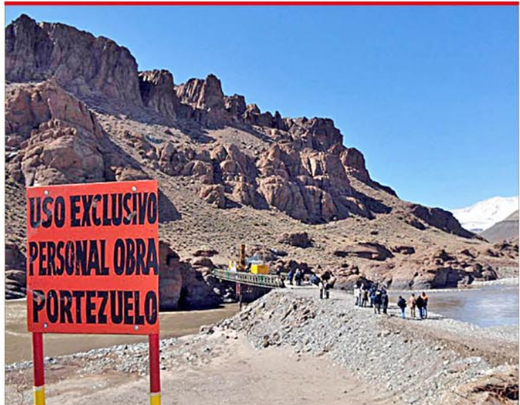
Remarcaron que se trata de fondos mendocinos por el perjuicio de la Promoción Industrial y se mostraron a favor de que Mendoza muestre una postura firme en el tema ante la Nación. (Pág.5)