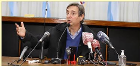
El intendente de San Rafael expresó que “el proceso de Portezuelo no tiene que tener grietas”. Y agregó: “Si el Gobernador plantea un laudo presidencial, vamos a acompañarlo”. (Pág. 5)

Félix sobre Portezuelo: “Tenemos que empujar todos juntos para que se pueda concretar la obra”