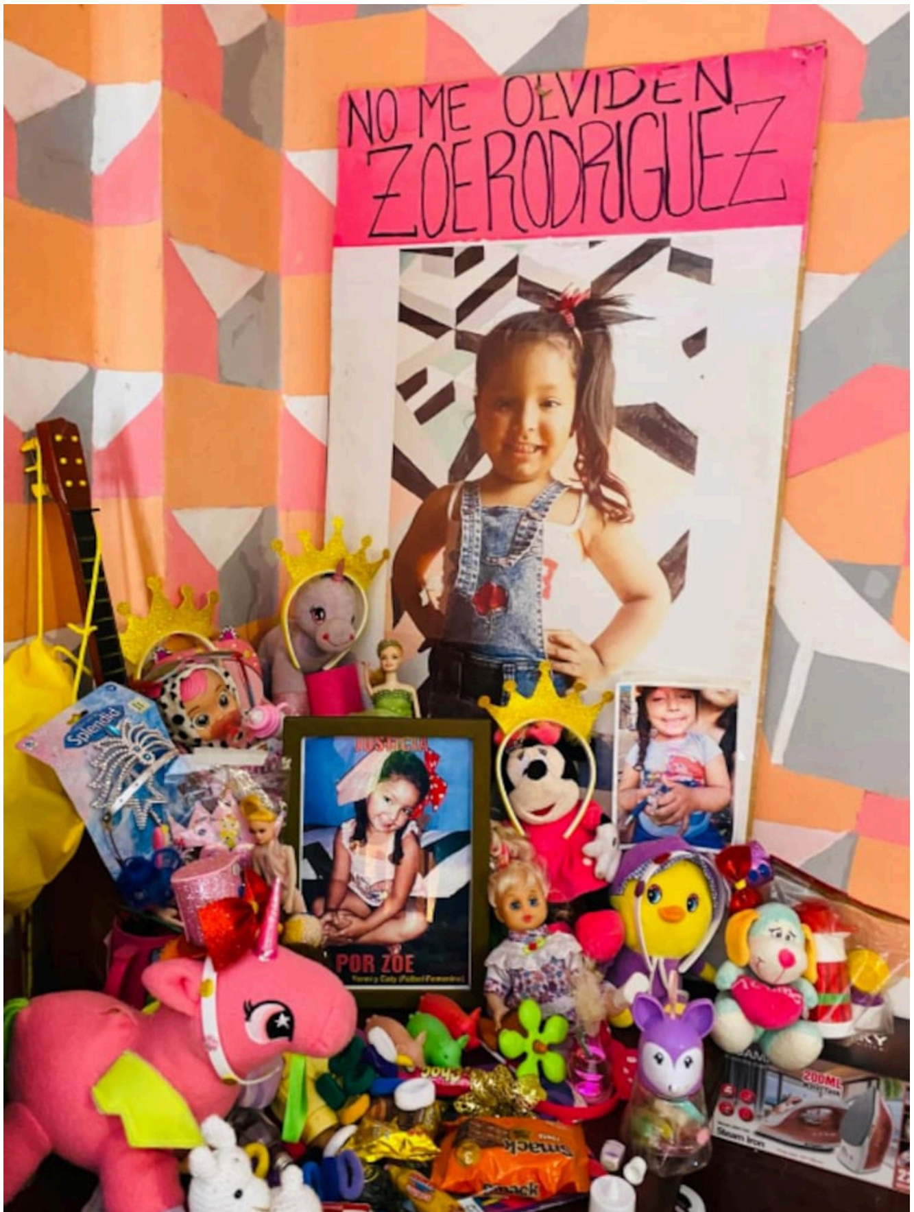
El altar en la casa de los abuelos de Zoe, donde vivió hasta los 3 años..