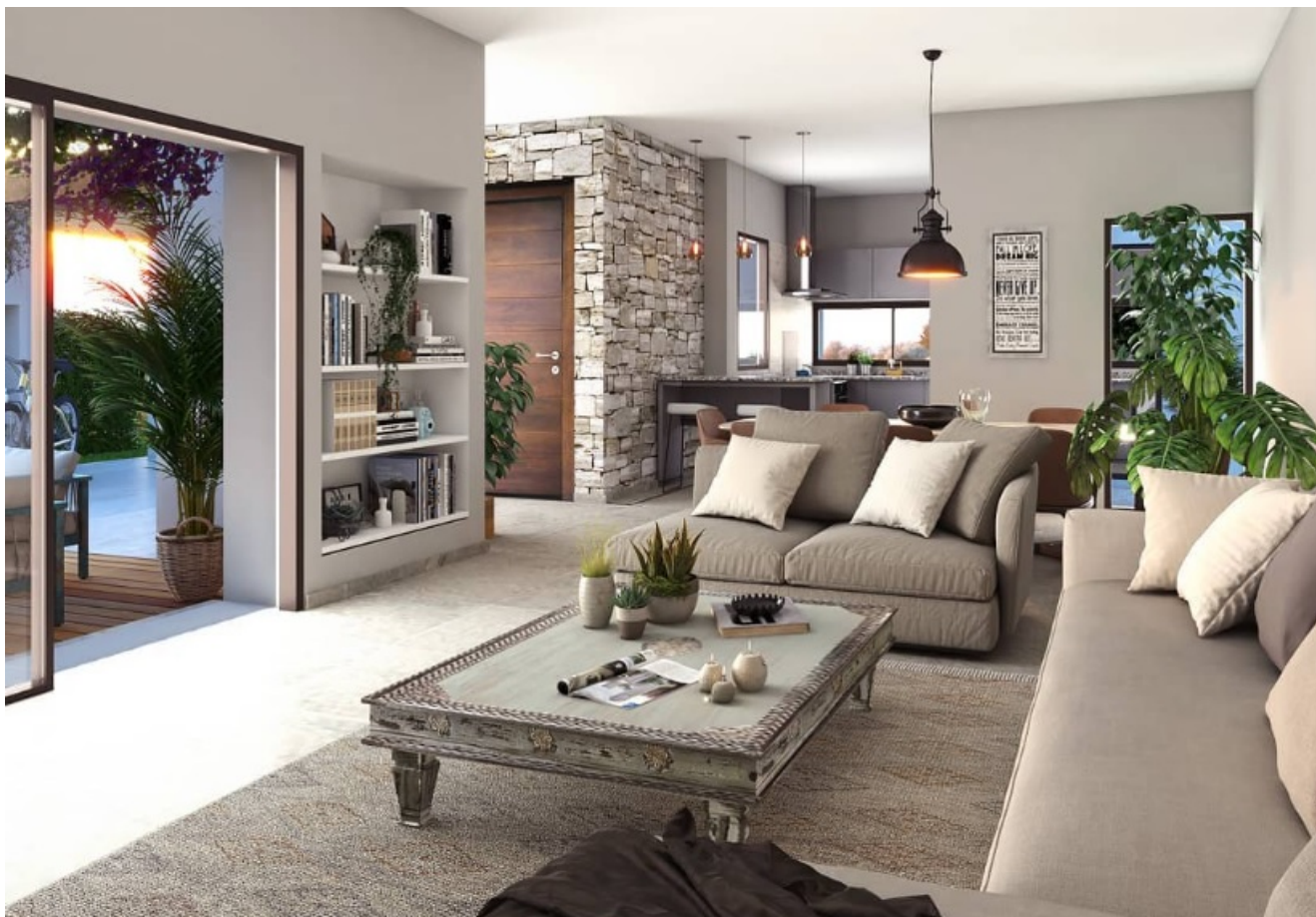
Imagen 3D realizada por la diseñadora para una empresa del exterior

Laura no usó ninguna de las plataformas mencionadas anteriormente. En su caso, accedió a la mayoría de sus clientes a través del boca en boca. “Muchos son argentinos que se fueron a vivir al exterior y ya me conocían de acá. Después le fueron pasando mi contacto a otras personas que viven afuera”, continuó.