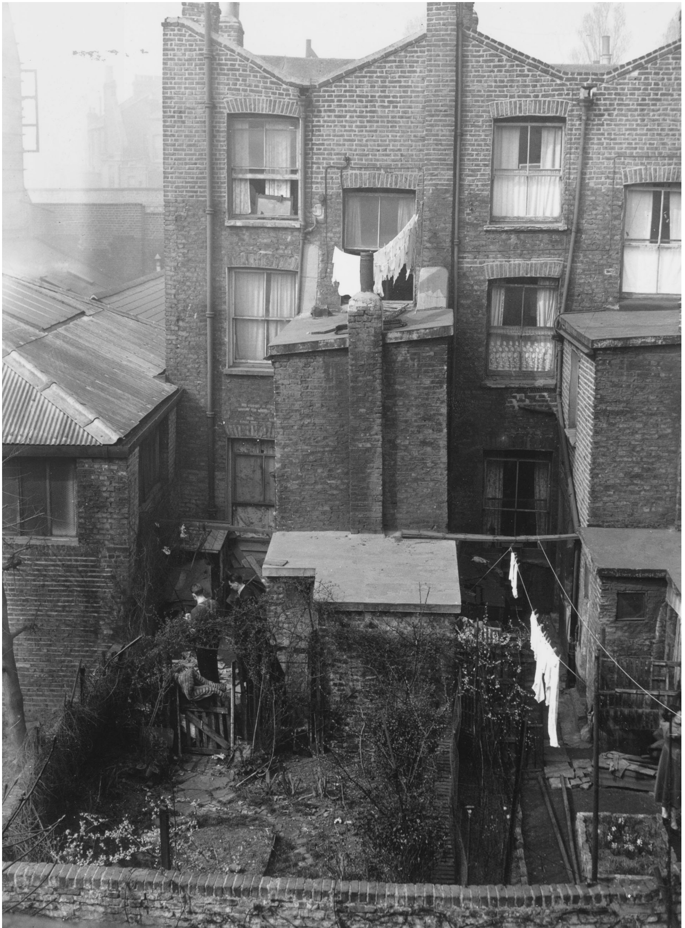
25 de marzo de 1953: La policía busca en el jardín trasero de 10 Rillington Place en Notting Hill, Londres, hogar de John Christie, donde se encontraron los cuerpos de tres mujeres y