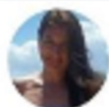
Sole mari @Solemali4