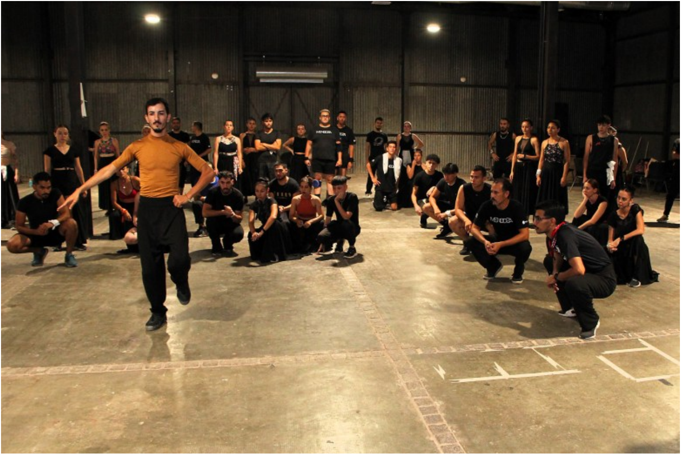
Imagen del ensayo 2024.

Un dato a tener en cuenta es que, tal como ha ocurrido el año pasado, todos los artistas iniciarán sus ensayos con los contratos firmados. Este año, el cachet para bailarines, actores y actrices será de 800.000 pesos,