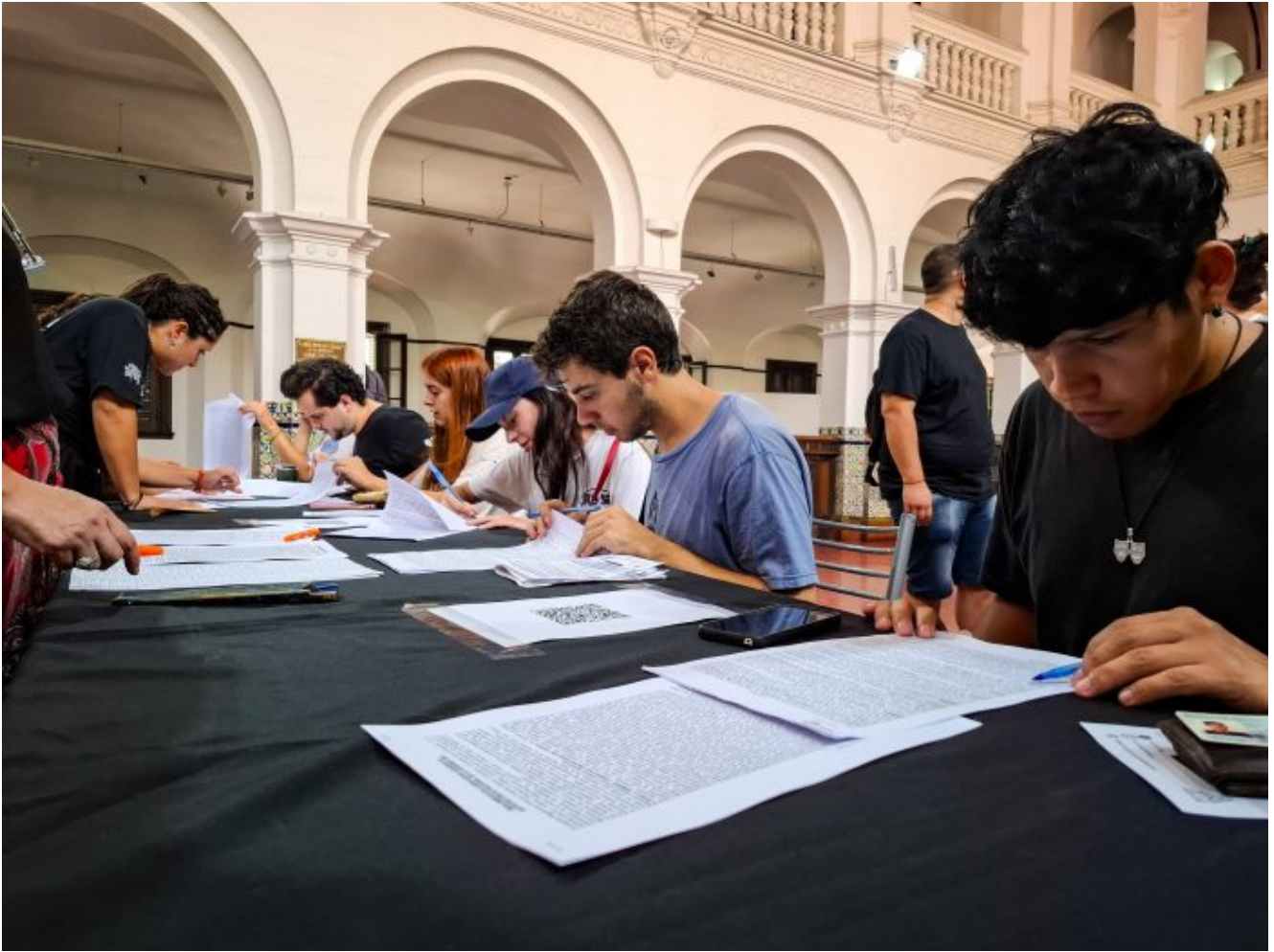
Imagen de archivo.