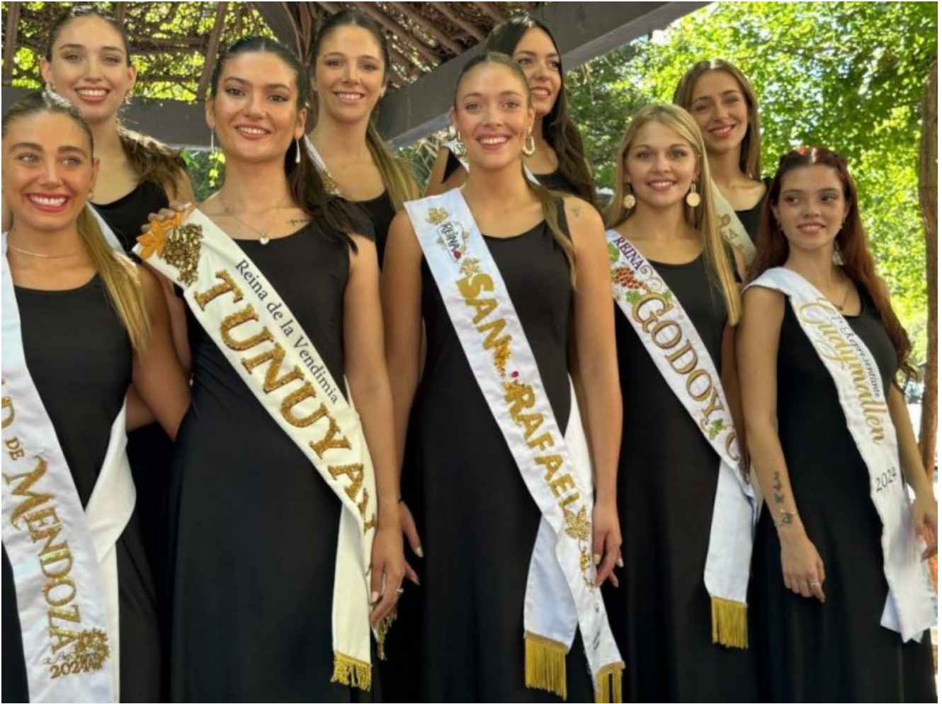
Imagen de archivo.

El pliego señala una partida de 13.999.980 de pesos e incluye la licitación de contratación directa para los servicios, diseño y confección, con material incluido.