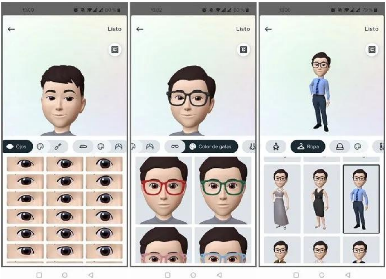
Avatar en Instagram.

para iniciar el proceso de creación, sino que pueden ser creados desde cero por los usuarios, quienes podrán elegir, de entre todas las características personalizables , si desean que sus representaciones digitales se parezcan a sus 'yo' reales.