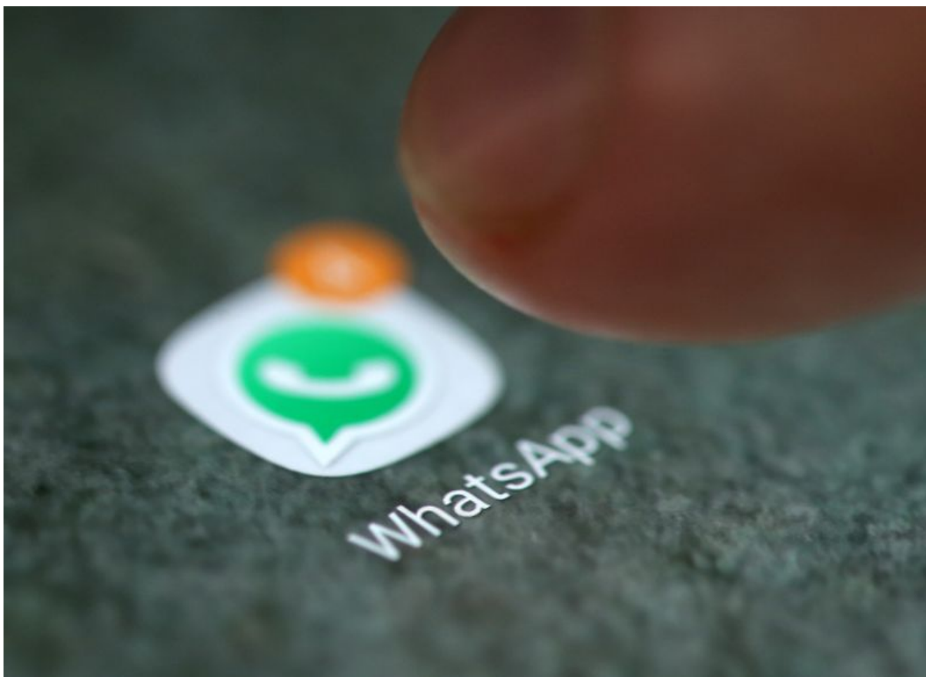
Foto de archivo ilustrativa del logo de WhatsApp en un smartphone Sep 15, 2017.

Aunque por el momento la aplicación de WhatsApp no tiene una versión premium con pagos por suscripción que esté abierta al público, sí existe una versión paga de la plataforma que solo está disponible para algunas cuentas específicas en planes de negocios.