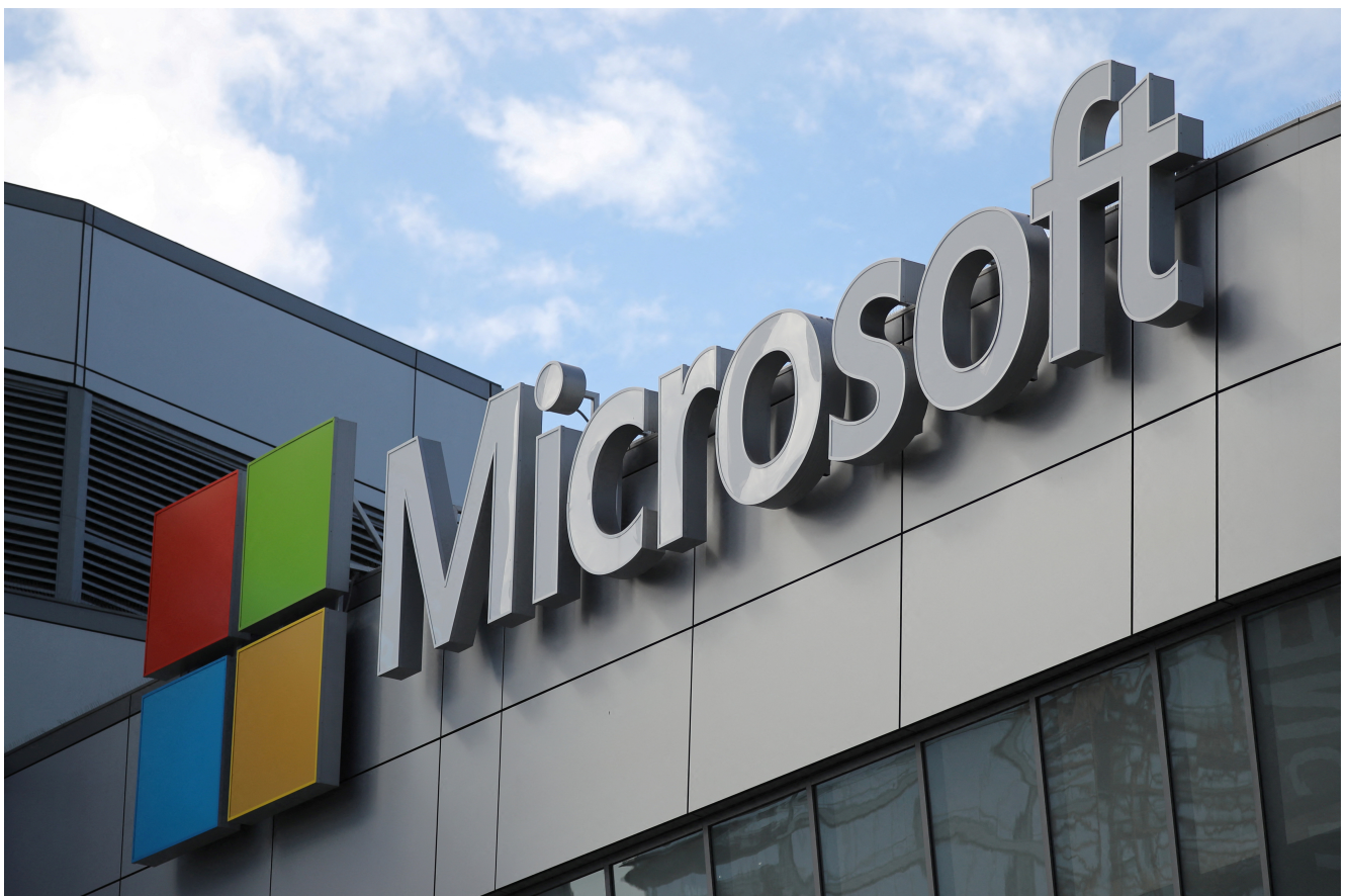
FILE PHOTO: A Microsoft logo is seen in Los Angeles, California U.S. November 7, 2017. REUTERS/Lucy Nicholson/File

Mientras más acciones sean realizadas, el usuario podrá completar la meta del día y podrá mantener un registro de cuántas emisiones de carbono dejó de producir gracias a esa función.